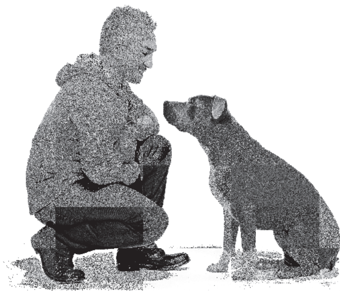
Моя правая рука, столь многому научивший меня Джуниор.

Это история покинутых и обретающих второй шанс. История о реабилитации и вхождении в совместимую семью. Для многих собак из шоу это последний шанс. Как вожак стаи я нахожу этим удивительным собакам новый дом, а готовые приютить их семьи учу заботиться о питомцах. Переводчиков с собачьего единички, но вожаком стаи может стать каждый.